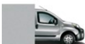
612 Světle šedá