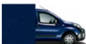
487 Tmavě modrá