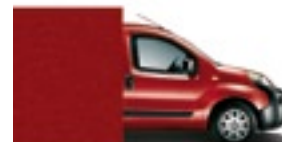
163 Tmavě červená