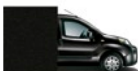
632 Tmavě šedá